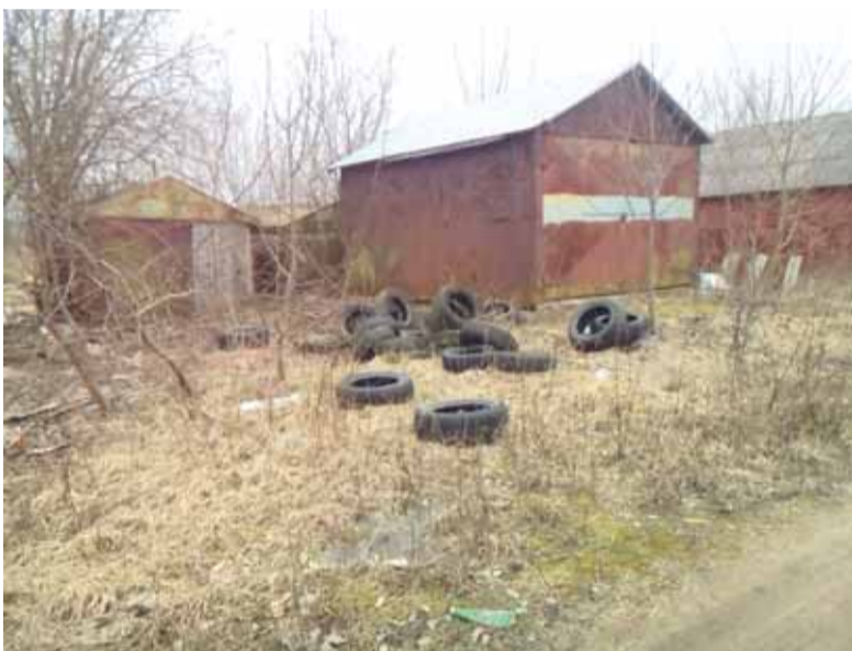
Pašnekovai teigia, kad teritorijoje šiuokšline ne garažų savininkai, o šilutiškiai, kurie šiuokšles atveža ir jas išpila net naktį.