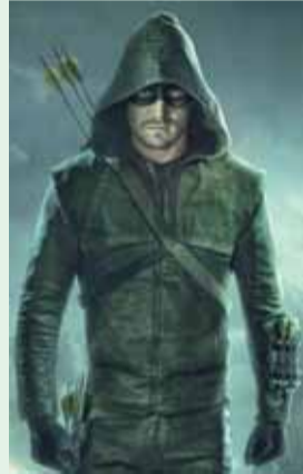
1.30 „Strėlė“. N-7.

6.30 „Džiūmandži“. 6.55 „Rožinė pantera“. 7.25 „Kempiniukas Plačiakelnis“. 7.50 „Volkeris, Teksaso reindžeris“. N-7. 8.50 „Volkeris, Teksaso reindžeris“. N-7. 9.50 24 valandos. N-7. 10.45 Žvaigždžių duetai. 13.30 „Kempiniukas Plačiakelnis“. 14.00 „Juodieji meilės deimantai“. N-7. 16.30 Labas vakaras, Lietuva. 17.25 Yra, kaip yra. N-7. 18.30 Žinios. 19.30 KK2. N-7. 20.25 Pagalbos skambutis. N-7. 21.30 Žinios. 22.15 „Pametęs galvą“. N-7. 23.55 „Kultas“. N-14. 0.45 „Vampyro diena“. N-14.