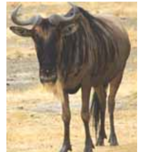
6.15 „Nepriylgstamieji gyvūnai“. N-7.

6.39 TV parduotuvė. 6.55 Reporteris. 7.45 Lietuva tiesiogiai. 8.15 „Nepriylgstamieji gyvūnai“. N-7. 9.20 „Miškinis“. N-7. 10.25 „Slaptieji agentai“. N-7. 11.30 „Moterų daktaras“. N-7. 12.30 Vaivos pranašystės. N-7. 13.30 „Nepriylgstamieji gyvūnai“. N-7. 14.40 TV parduotuvė. 14.55 „Miškinis“. N-7. 16.00 Žinios. 16.25 „Magda M.“. N-7. 17.30 „Viskas apie gyvūnus“. 18.00 Reporteris. 18.55 „Miškinis“. N-7. 20.00 Žinios. 20.25 Muzikinis gimtadienis. 22.30 Reporteris. 23.00 „Dievo dovana“. Mistinis trileris. N-14. 1.35 „Mirtina tyla“. Trileris. N-14. 3.15 „Nepriylgstamieji gyvūnai“. N-7. 4.05 „Dievo dovana“. Mistinis trileris. N-14. 5.55 „Laukinis pasaulis“.