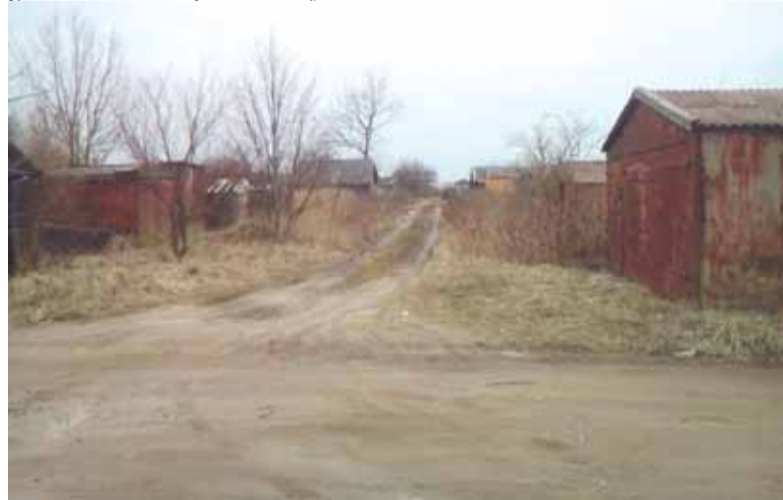
Teritorijoje yra daugiau nei pusšimčio žmonių garažai.

Vyrai neslėpė – garažai jiems labai svarbūs. Jie net dviratį remontuoti atvažiuoja čia. Yra apie 50 žmonių, kurių pastatai stovi šioje, Šilutės rajono savivaldybei priklausančioje žemėje. Yra tokių, kurie tik keletą kartų per metus ateina į garažus, bet daugelis daug laiko čia leidžia. Neabejojama, jei bus pašalinti pastatai, šioje vietoje atsiras neoficialus sąvartynas, mat net dabar vyrams tenka nuolat vaikyti šilutiškius, atvežančius įvairias šiukšles. Daugelis jų atliekas veža net naktį, kad dieną nereikėtų susidurti akis į akis su garažų šeimininkais. „Tikrai ne mes čia šiukšliname“, – tvirtino susirinkusieji.