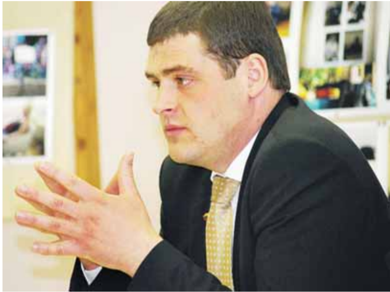
R. Žemaitaitis.

Jis nepasikuklino ir pasigirti, kad toks nėra, kaip kalba kolegės: „Aš treji metai esu Ekonomikos komiteto pirmininku. Trejus metus dirbu Seime, trejus metus registruoju projektus ir treji metai tie projektai praeina. Mes padarėme daug gerų dalykų pačioje frakcijoje ir pačiame Seime, ir nereikia žeminti mūsų darbo. Paprastas dalykas - baigiame. Tai susirinkime daiktus ir dinkime lauk iš viso. Aš įsivaizduoju, kad šiandien kongreso pranešimas turėtų būti, jog partija „Tvarka ir teisingumas“ pasitraukia iš valdančiosios koalicijos, nes viskas yra blogai, ką mes padarėme“.