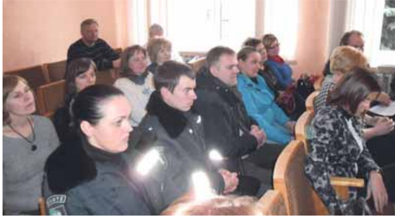
Saugiškiai drąsiai uždavinėjo klausimus rajono vadovams.

„Teikiant socialinių įgūdžių ugdymo ir palaikymo paslaugas glaudžiai bendradarbiaujame su Saugų J. Mikšo ir Vilkyčių pagrindinėmis mokyklomis. Seniūnijoje pagal kompetenciją organizuota vaikų teisių apsaugos prevencija bei darbas su socialinės rizikos grupės, su problemineis ir šeimo-