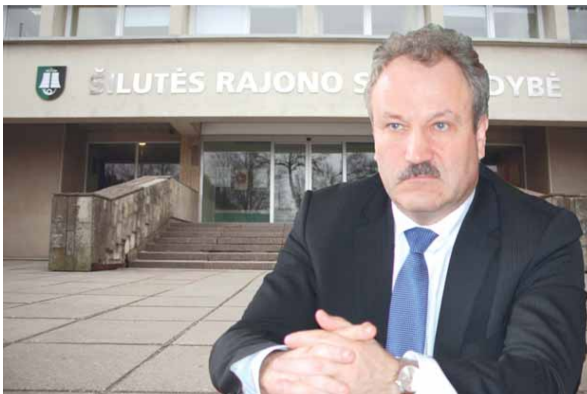
Meras V. Laurinaitis vieną sakė, bet visi kas kita padaryta.