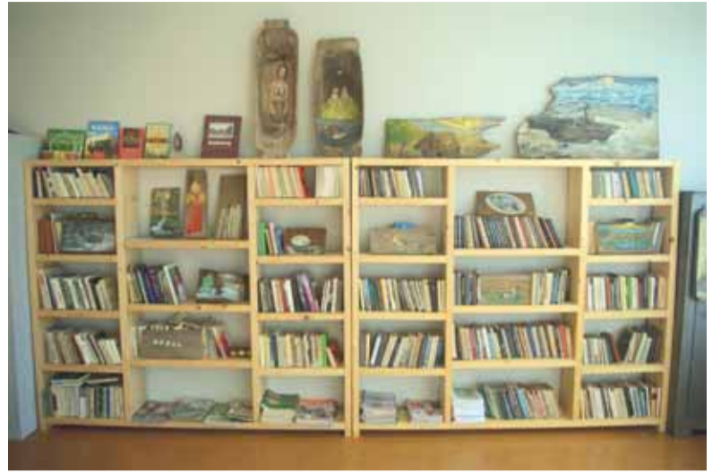
Bibliotekos - tai žmogaus dvasinių vertybių lobynas. (G. Leibnecas)

Esame labai dėkingi visiems Šilutės rajono gyventojams, kurie 2016 metais vasario ir kovo mėnesiais dovanavo knygas mūsų bendruomenei: