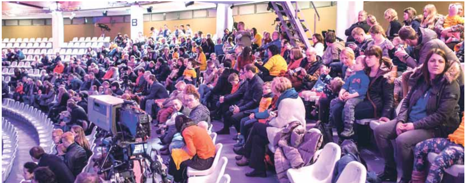
Pasaulinės Dauno sindromo dienos minėjimą delfinariume susirinko gausus būrys žmonių.

Vakar Lietuvos jūrų muziejaus Delfinų terapijos centre Klaipėdoje suorganizuota ir mokslinė - praktinė konferencija „Dauno sindromo diena Lietuvoje 2016“. Jos dalyviai turėjo galimybę susipažinti su Delfinų terapijos centre vykdoma veikla, stebėti delfinų pasirodymą. Be to, konferencijos metu buvo pristatytas leidinys „Dauno sindromas: patarimai tėvams ir specialistams“. Jį parengė VU Medicinos fakulteto Žmogaus ir medicininės genetikos katedros ir Filosofijos fakulteto autorių ko-