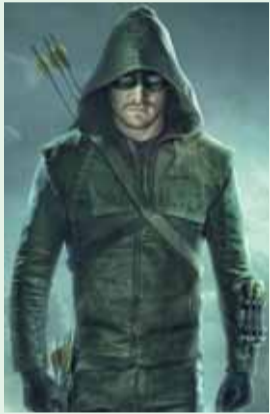
1.40 „Strėlė“ N-7.

6.30 „Smalsutė Dora“. 6.55 „Madagaskaro pingvinai“. 7.25 „Rožinė pantera“. 7.50 „Volkeris, Teksaso reindžeris“ N-7. 9.50 24 valandos N-7. 11.55 Yra, kaip yra N-7. 13.05 Pričiupom! N-7. 13.35 „Svajonių princas“. 14.35 „Juodieji meilės deimantai“ N-7. 16.30 Labas vakaras, Lietuva. 17.25 Yra, kaip yra N-7. 18.30 Žinios. 19.30 KK2 N-7. 20.25 Su cinkeliu N-7. 21.30 Žinios. 22.15 „Blyksnis“ Veiksmo filmas. N-14. 0.05 „Judantis objektas“ N-7. 0.55 „Vampyro dienašė“ N-14.