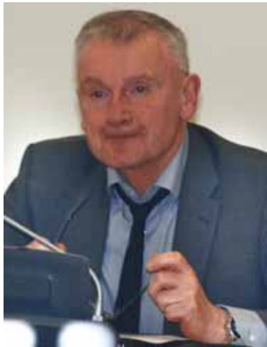
J. Jatautas tikisi, kad sukurtą situaciją bus sukritikuota.

Įstatymai numato, jog šios sudėties komisija turi prižiūrėti, kaip Savivaldybės tarybos nariai laikosi LR vietos savivaldos įstatymo, Valstybės politikų elgesio kodekso, reglamento, kitų teisės aktų, reglamentuojančių Savivaldybės ta-