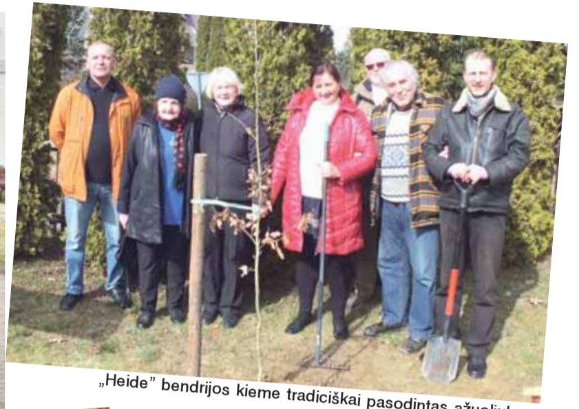
„Heide“ bendrijos kieme tradiciškai pasodintas ažuoliukas.