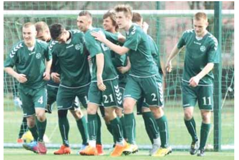
Po ketverių „Šilutės“ rungtynių su Kauno komanda „Kaunas“ iškovota pirmoji sezono pergalė - 0:3.

- Pagrindinė ir didžiausia bėda - neturime kur treniruotis. Paskui - trūksta visko. Nenoriu kalbėti vien apie negatyvus, tačiau situacija katastrofiška - trūksta elementarios aprangos. Šiuo metu viskas remiasi į komandos finansus. Kitų federacijoje rungtyniau-