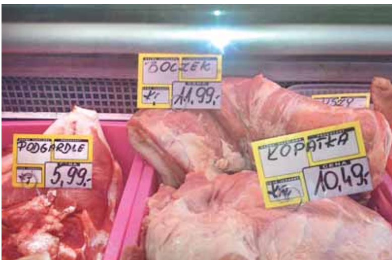
Mėsa Lenkijoje kainuoja kur kas pigiau.

juknaitiškis. Jis tvirtino, kad įrenginėdamas savo šeimos namą statybinių medžiagų – glaisto, plytelių, tapetų ir kt. - Lietuvoje taip pat nepirks, mat domėjosi kainomis ir jos mūsų šalyje daug didesnės. D. Stanišauskas pirkė klozetą Šilutės statybinių prekių parduotuvėje. Čia jis kainavo 150 eurų (su akcija). Vėliau Lenkijoje matė tokią pat klozetą ir buvo tik vienintelis skirtumas tas, kad jis be akcijos kainavo 130 eurų.