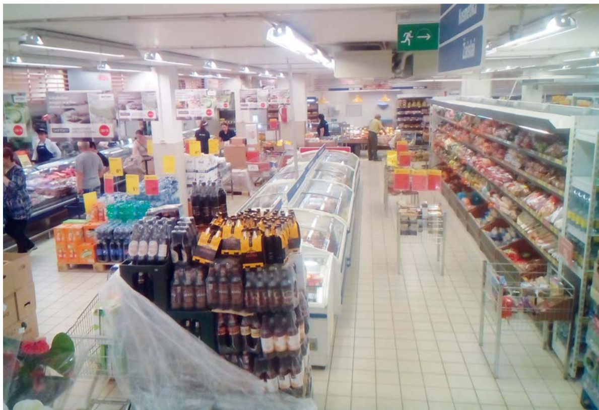
Šilutės prekybos centruose pardavėjos nesėdėjo rankų sudėjusios.

Lietuvoje antradienį prasidėjo pilietišku tautiečių inicijuota akcija „Neikim į parduotuves tris dienas“. Prekybininkai skaičiuoja, jog pirkėjų ištis sumažėjo, tačiau tai esą lėmė ne tik protestas, bet ir kitos priežastys. Kovą prekybos centrums paskelbė aktyvūs piliečiai neketina pasiduoti ir jau kurpia planus apie naujus protestus. Domėjomės apie situaciją Šilutėje.