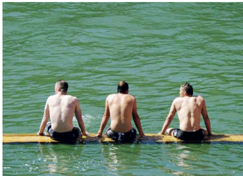
Praėjusiais metais maudyklų vanduo nebuvo užterštas.

Kintų paplūdimyje labiausiai mėgsta ilsėtis mamos su savo atžalomis. Kol šie maudosi, jų gimdytojos gali tiesiog pasidėginti, mat ten yra labai negili – 60-80 centimetrų gylis. Anot A. Kližentis, rei-