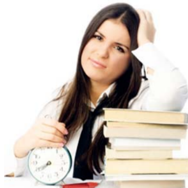
Beveik trečdalyje Lietuvos pagrindinių mokyklų ugdytiniai neįgyja matematikos pagrindų ir nepasiekia net patenkinamo lygmens.