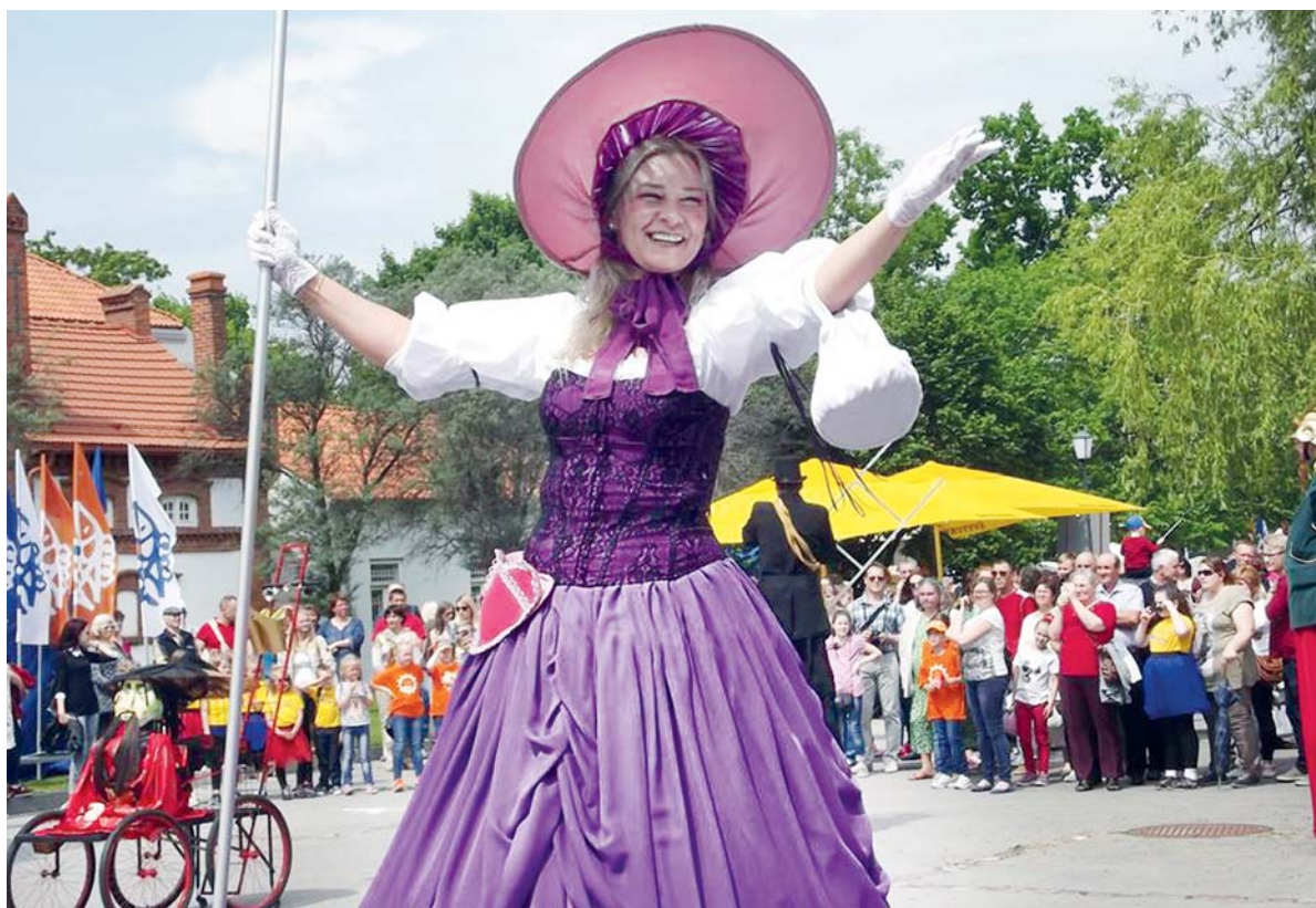
Šilutės kamerinio dramos teatro aktoriai pakvietė į gatvės vaidinimą.

P raėjusį šeštadienį Šilutės miestas šventė 505-ąjį gimtadienį. Kaip ir kiekvienais metais, vos tik paskelbus miesto šventės programą, miestiečiai suskubo komentuoti. Ir kaip kiekvienais metais buvo tiek burbančių skeptikų, kuriems viskas visada negerai, tiek ir entuziastų, kurie tik ir laukia progos šventę švęsti. Bet tiek vieni, tiek ir kiti supanašėja tuo, kad nė viena pusė nežino, ko nori konkrečiai.