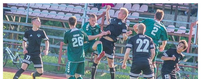
Po baudinių serijos šilutiškiai laimėjo 4:3 ir pateko į kitą LFF taurės etapą.

Š ią savaitę skandalingai nuaidėjo futbolo rungtynės tarp „Šilutės“ ir „Šilo“ vienuolių - po to, kai į viešumą išlindo varžovų bandymai realizuoti įvarčius nuo baudinių linijos. Lietuvos futbolo federacijos (LFF) taurės turnyro 2-ojo etapo rungtynės, kuriose Kazlų Rūdos „Šilas“ po kontraversiškos baudinių serijos nusileido „Šilutės“ komandai, sulaukė ir LFF drausmės komiteto dėmesio.