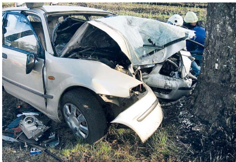
Šeštadienį kraupi avarija įvyko Vilkyčiuose.

Š eštadienio vakarą Vilkyčių kaime įvyko kraupi avarija, kurios metu automobilį sumėtė ir jis trenkėsi į medį. Visi trys automobiliu važiuavę žmonės – vairuotojas ir dvi keleivės – sunkiai sužaloti.