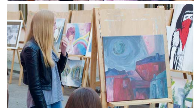
Renginio akimirkos.