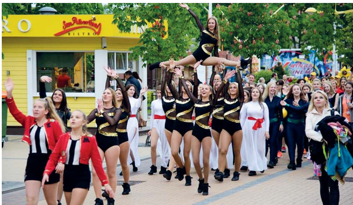
Masinėje renginio atidarymo eisenoje – „Atėnės“ merginos.

S u gražiu oru ir vis anksčiau patekančia saule sportas, menas, draugystė bei nuolatinis siekis tobulėti į Palangą savaitgalį sukviėt šimtus sportininkų. Muzikos ritmu kurorte šurmuliavo masinis, ne vieną tūkstantį sporto entuziastų kasmet priviliojantis festivalis „Sportas visiems“.