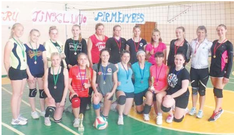
„Vilkyčių“ komanda – 2016 metų Šilutės rajono moterų tinklinio pirmenybių nugalėtoja.

Po rimtų ir atkaklių kovų, kurios truko balandį ir gegužę, išai-