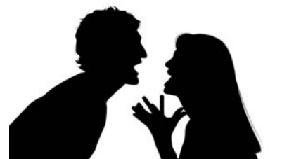
Tauragės AVPK informacija

Gegužės 29 d., apie 20.25 val., namo, esančio Šilgalių k., kieme, neblaivus (2,31 prom. alkoholio) vyras, gim. 1982 m., naudojo fizinį smurtą prieš neblaivią (2,25 prom. alkoholio) žmoną, gim. 1984 m., spirdamas jai koja į nosies sritį. Įtariamasis sulaikytas.