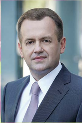
Artūras Skardžius Lietuvos Respublikos Seimo narys