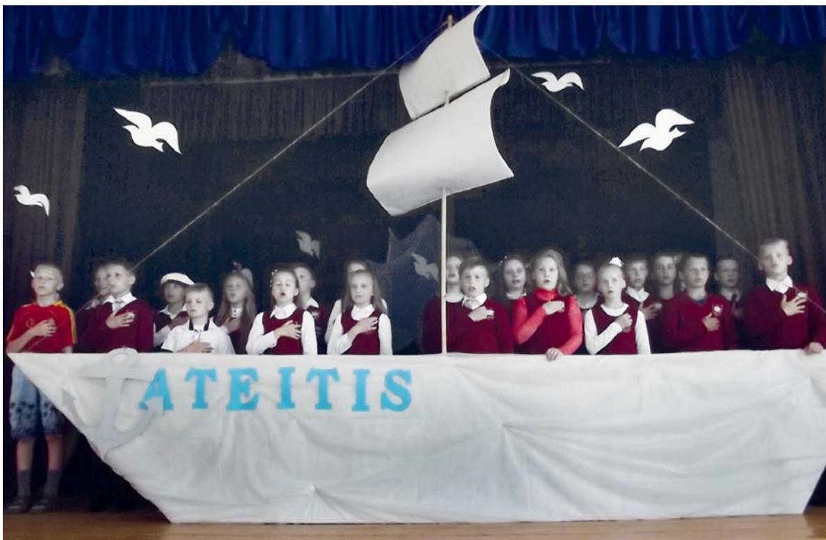
Pagėgiškių ketvirtokų šventės akimirks.

G egužės 31-ąją Pagėgių pradinėje mokykloje vyko pirmojo pažymėjimo šventė – ketvirtokų išleistuvės. Mokyklą baigė trisdešimt du mokiniai, lanke dvi klases.