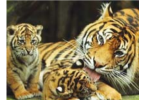
6.45 „Tigrų sala“.

7.09 TV parduotuvė. 7.25 Šiandien kimba. 8.25 „Nepriylgstamieji gyvūnai“. N-7. 9.30 Skinsiu raudoną rožę. 10.00 Gyvenu čia. 11.00 „Detektyvas Linlis“. N-7. 13.00 „Mikropasauliai“. N-7. 13.40 Rio 2016. 13.50 „Mama detektyvė“. N-7. 15.00 Žinios. 15.20 Ar žinai, kad...? N-7. 15.25 „80-ieji“. N-7. 16.00 Žinios. 16.20 Ar žinai, kad...? N-7. 16.25 „80-ieji“. N-7. 17.00 Žinios. 17.28 Ar žinai, kad...? N-7. 17.30 „Pėdsakas“. N-7. 19.30 „Išpuodingiausi gamtos reiškiniai“. N-7. 20.30 „Tigrų sala“. N-7. 21.00 Žinios. 21.28 Ar žinai, kad...? N-7. 21.30 „Šetlando žmogžudystės“. N-7. 23.50 „Kruvina žinutė“. N-14. 1.50 „Išpuodingiausi gamtos reiškiniai“. N-7. 2.40 „Šetlando žmogžudystės“. N-7. 4.25 „Kruvina žinutė“. N-14. 5.55 „Išpuodingiausi gamtos reiškiniai“. N-7.