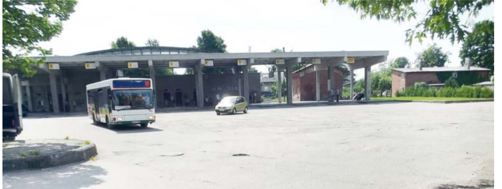
Šilutės autobusų stotis yra apverktinos būklės, todėl ją jau seniai reikėjo arba rekonstruoti, arba nugriauti ir statyti naują...