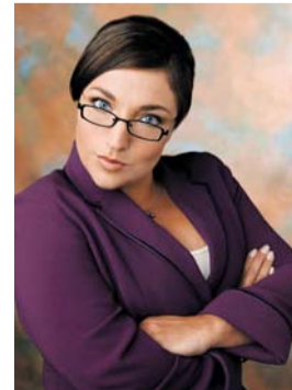
5.40 Superauklė. N-7.

6.20 Teleparduotuvė. 6.50 Būrėja. 8.00 Daktaras Ozas. N-7. 8.55 „Sodininkų pasaulis“. N-7. 9.30 Daktaras Ozas. N-7. 10.25 Monstrų karai. 11.25 „Zoologijos sodo naujagimiai“. N-7. 12.00 Turkiški skanėstai. 12.30 Reičelės Alen pyragų dienoraštis. 13.00 „Mylėk savo sodą“. N-7. 14.00 Kas namie šeiminkas? 15.00 Superauklė. N-7. 15.55 Mirtini triukai. 16.30 Būrėja. 17.35 „Tėvas Motiejus“. N-7. 18.30 „Mano priešo kūnas“. N-7. 21.00 „Mergina, kuri užkliudė širšių lizdą“. N-14. 22.50 „Nepėsčias Džo“. Veiksmo komedija. N-7. 0.40 „Neįtikimieji. Išdavystės istorijos“. N-14. 1.30 „Laiko gijos“. N-7. 2.55 „Monstrų karai“. N-7. 3.40 „Zoologijos sodo naujagimiai“. N-7. 4.00 Turkiški skanėstai. 4.25 Reičelės Alen pyragų dienoraštis. 4.50 Mylėk savo sodą.