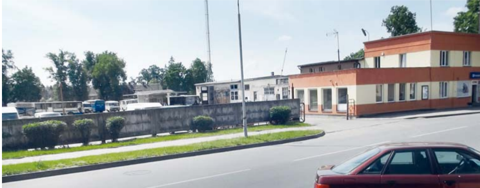
Bus nugriauti „Šilutės autobusų parko“ teritorijoje esantys pastatai, kurie nors ir yra kultūros vertybių apsaugos zonoje, bet, ačiū Dievui, neįrašyti kultūros vertybių registre.