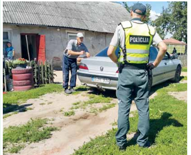
Skaudi nelaimė įvyko Katyčių sen., Versmininkų k.