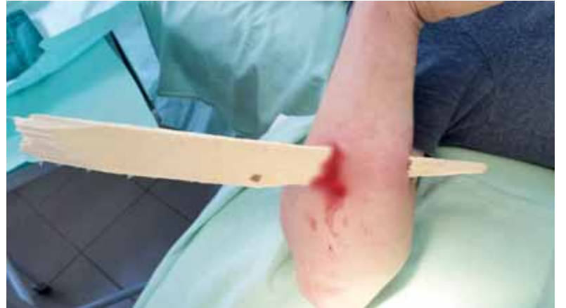
Ši „rakštis“ įstrigo šilutiškiui. Esant tokiam sužalojimui, buvo galima sulaukti ir komplikacijų.