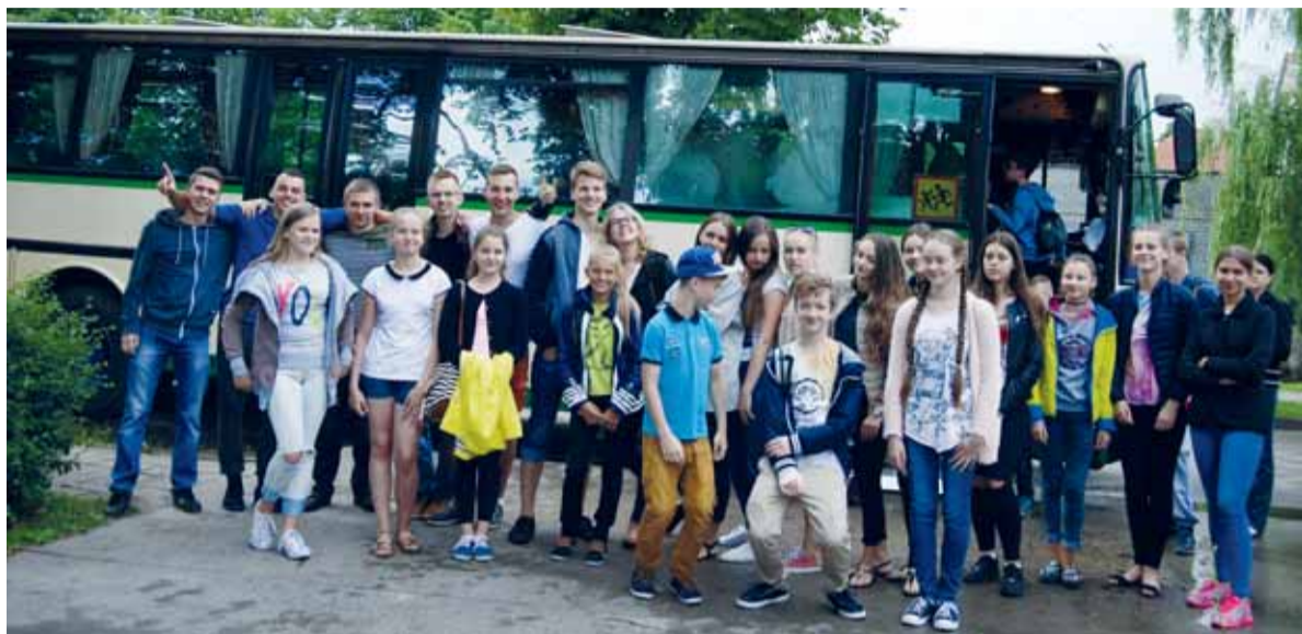
Šiomet dalis moksleivių į sostinę vyko nelabai patogiais autobusais.

L iepos 4-10 dienomis Šilutės rajono mokyklų chorai kartu su jaunimo liaudiškų ir sportinių šokių kolektyvais dalyvaus Lietuvos moksleivių dainų šventėje „Tu mums viena“. Šilutiškiai džiaugiasi, jog gali dalyvauti šioje šventėje, tačiau neslepia, jog nuvykus į sostinę tenka išgyventi gėdos jausmą.