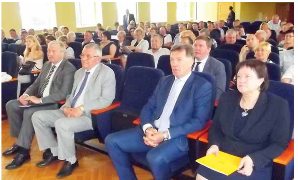
Suvažiavime dalyvavo Ministras Pirmininkas Algirdas Butkevičius ir žemės ūkio ministrė Virginija Baltraitienė (dešinėje).

ūkininkų vaikų ūkininkavimą. LŪS jungia 43 narius, gegužę į jos gretas vėl sugrįžo Rokiškio rajono ūkininkų sąjunga. Bendrai Lietuvoje yra apsijungę apie 4 300 ūkininkų ūkių.