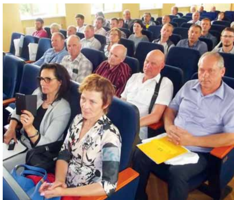
LŪS suvažiavime – Šilutės rajono ūkininkai (pirmoje ir antroje eilėje).

L iepos 1-ąją Akademijos kultūros centre (Kėdainių r.) įvyko dvidešimt aštuntasis Lietuvos ūkininkų sąjungos (LŪS) suvažiavimas. Jame dalyvavo ne tik žemdirbiai, bet ir Ministras Pirmininkas Algirdas Butkevičius, Europos Parlamento narys Bronis Ropė, žemės ūkio ministrė Virginija Baltraitienė, Seimo nariai, ministrai, atsakingų žemdirbiškų organizacijų vadovai. Ir, aišku, - būrys Šilutės rajono bei Pagėgių savivaldybės ūkininkų, o su jais - ir „Šilokarčemos“ žurnalistas.