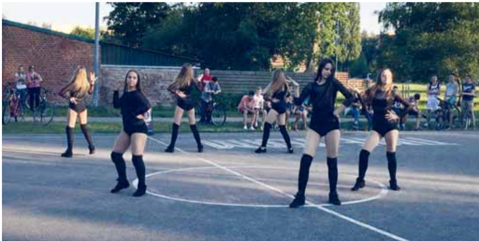
Visus savo pasirodymais džiugina „Atėnė“ šokėjos.