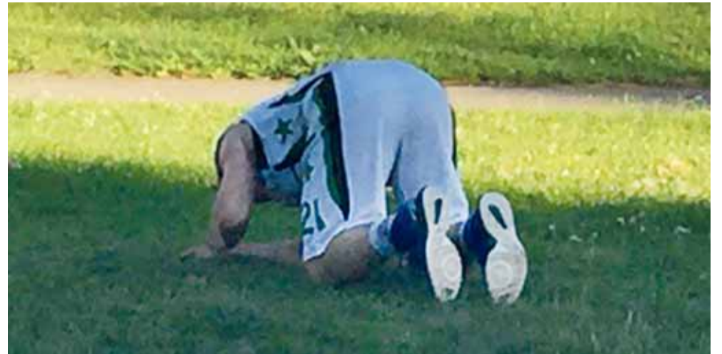
Krepšinis gatvėje turi kitų niuansų nei krepšinis salėje.

B irželio mėnesį Šilutėje pirmą kartą startavo Šilutės krepšinio gatvės lyga. Praėjusią savaitę buvo sužaisotos paskutinės pirmojo rato rungtynės ir ši lyga pasiekė pusiaukele.