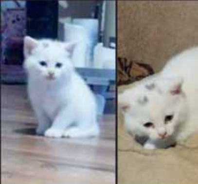
Gyvūnų globos namai VšĮ „Gyvūnų užuovėja“ DOVANOJA gražius, mielus kačiukus. Tel. 8 689 01 313

VšĮ „Gyvūnų užuovėja“ ieško namų ir mylinčių šeiminių gražiam, stambiam šuniukui vardu Grantas. Grantas buvo rastas negyvenamojoje sodyboje, iš kurios nė per žingsnį nesitraukė. Šis jo poelgis akivaizdžiai pasako, jog ten buvo paliktas šeiminių. Stipraus, įdomaus ir savito charakterio. Myli labai vaikus ir yra pavaldus žmogui. Grantas labai sargus! Su kitais gyvūnais nelabai draugauja.