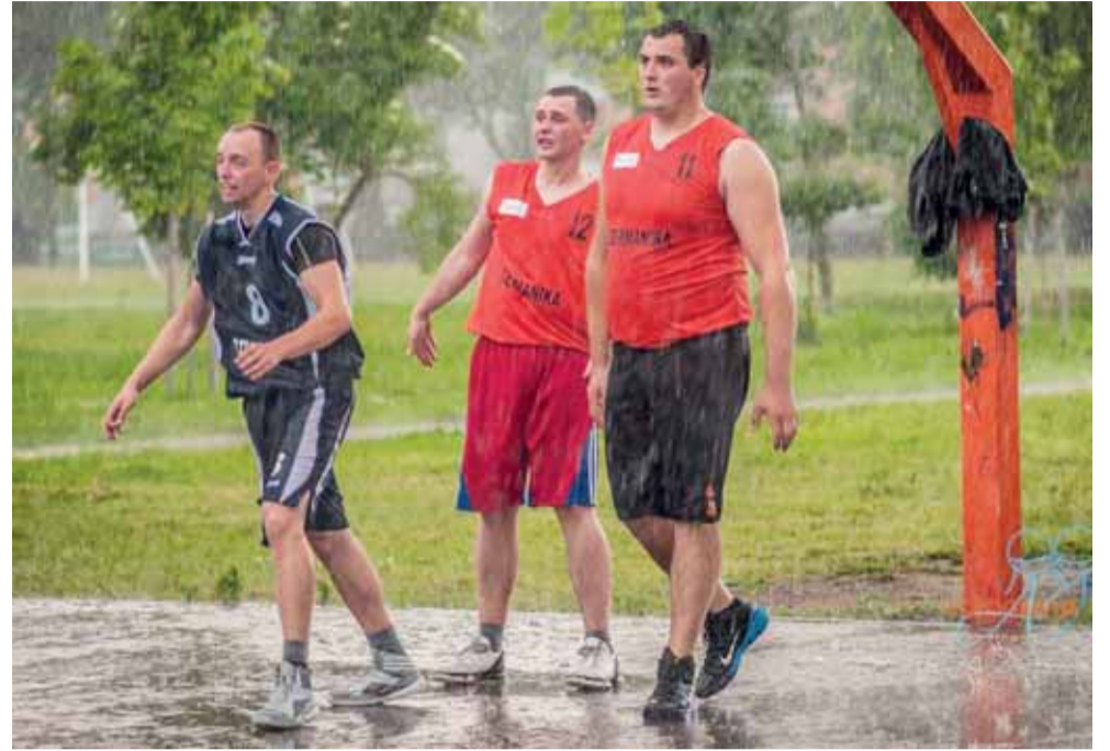
Gatvės lygai nėra blogo oro.