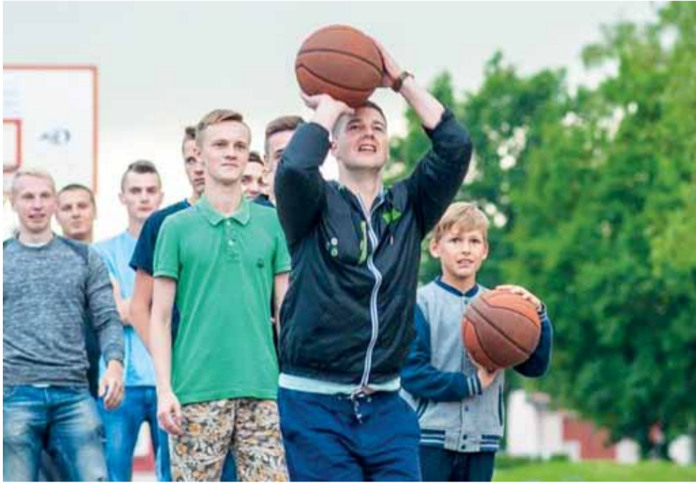
Žaidimai žiūrovams, kurie nori laimėti prizų.