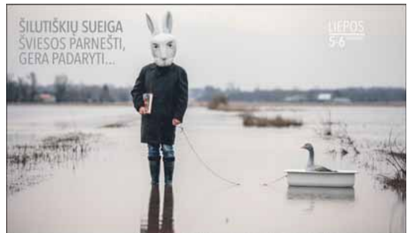
Šilutiškių sueiga šviesos parnešti, gera padaryti... LIEPOS 5-6