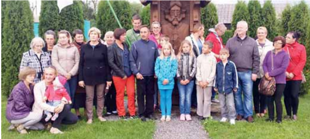
Gardamo gyventojai giedojo Tautišką giesmę.