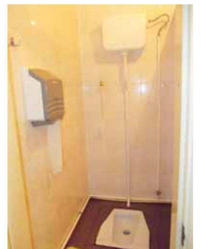
Tualete – švaru, tvarkinga, beveik kaip darbo kabinete...

Kad būtų taip, kaip pasakojo ši moteris, reikia nemažai lėšų jo išlaikymui. A. Dobilinskas teigė, jog norint, kad tualetas nebūtų nuos-