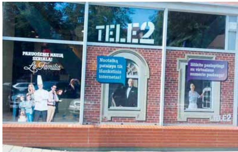
Sparčiausią mobilųjį internetą šilutiškiams teikia „Tele2“.