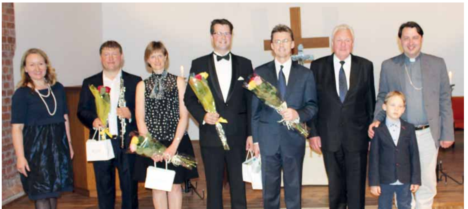
Muzikantai ir festivalio organizatoriai.

„Karaliaus Mindaugo karūnavimo diena labai svarbi mūsų valstybei. Galime didžiuotis, kad Lietuva, istorijos vingiuose patyrusi tokią daugybę įvykių, sugebėjo nusi-kratyti okupacijos jungo ir vėl tapti laisva bei nepriklausoma. Valsty-