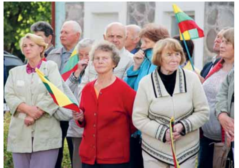
Švėkšniškiai jau aštuntą kartą rinkosi prie Šv. ap. Jokūbo bažnyčios.

Išskirtinai Tautiška giesmė giedota Rusnėje – šiemet rusniškiai nusprendė šventę perkelti iš miestelio centro į greta tekančią Atmatos upę ir taip simboliškai apjungti tai, kas svarbiausia Lietuvai bei Rusnės žmonėms. Jie tautišką giesmę užtraukė laivuose. Tikimasi, kad toks Karaliaus Mindaugo karūnavimo dienos