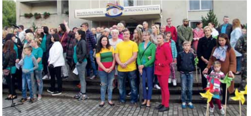
Tautiška giesmė giedota prie Šilutės kultūros ir pramogų centro.

L iepos 6-oji –Valstybės, Karaliaus Mindaugo karūnavimo diena. Tačiau, 21 valandą, jau daugelį metų kartu su visa Lietuva bei po pasaulį pasklidusiais lietuviais ir Šilutės rajono gyventojai gieda Tautišką giesmę.