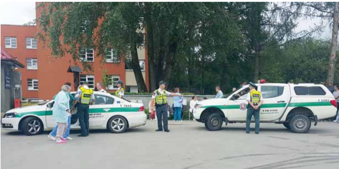
Švėkšnoje įsikūrusiame Klaipėdos jūrininkų ligoninės Psichiatrijos departamente sujudimas užsitęsė daugiau nei tris valandas.

K ai daugelis šventė pirmojo suvienytos Lietuvos valstybės valdovo, kunigaikščio Mindaugo vainikavimo karaliumi šventę – Valstybės dieną, didelius neramumus išgyveno Švėkšnoje įsikūręs Klaipėdos jūrininkų ligoninės Psichiatrijos departamentas. Dėl pranešimo apie bombą buvo evakuoti beveik 200 žmonių.