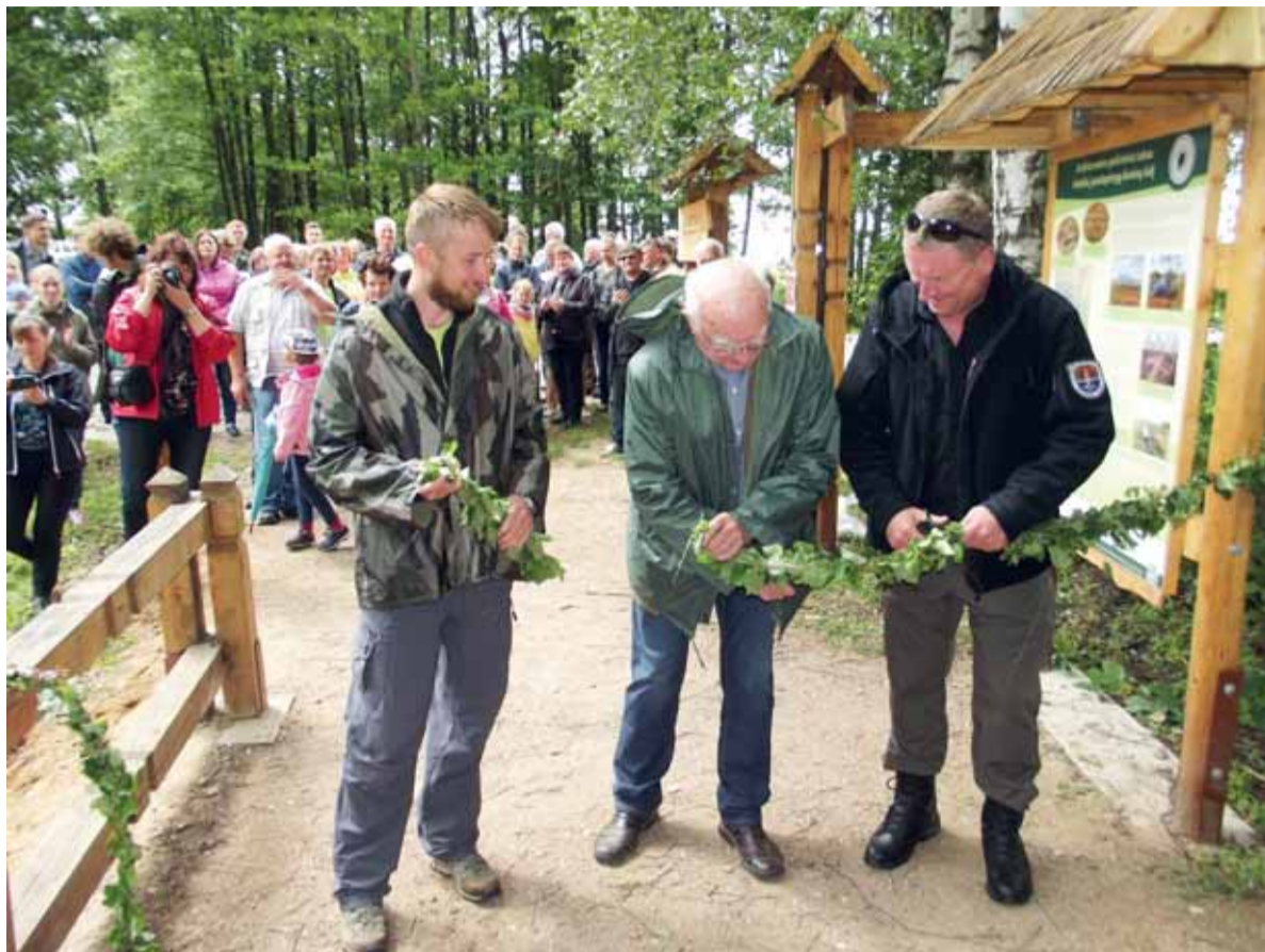
Pažintinio tako atidarymo šventės akimirkos.