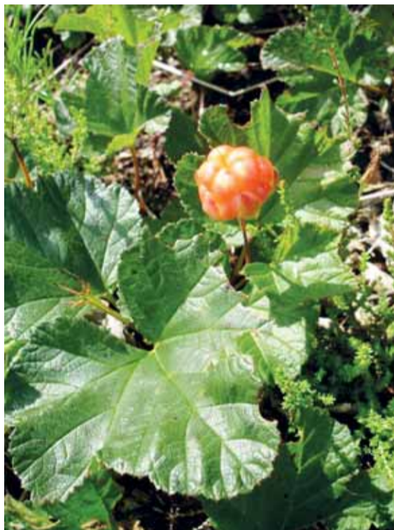
Avietė tekšė ( Rubus chamaemorus ).