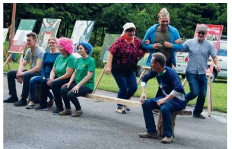
Drausiasi įvairių bendruomenių atstovai dalyvavo įvairiuose žaidimuose.