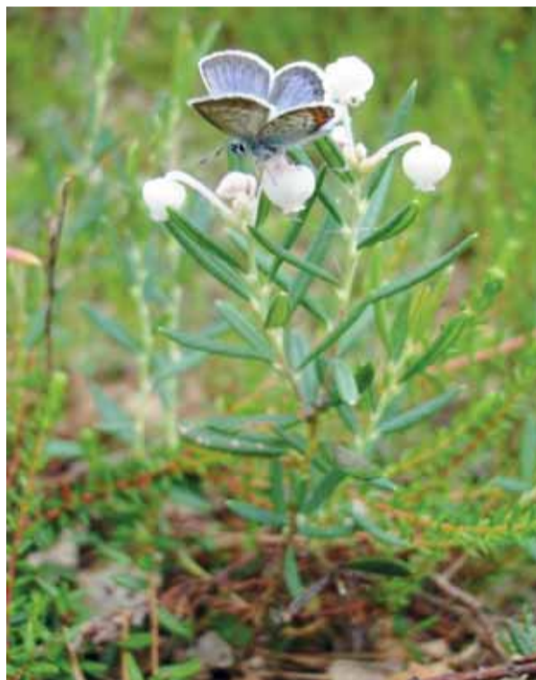
Siauralapė balžuva ( Andromeda polifolia ).