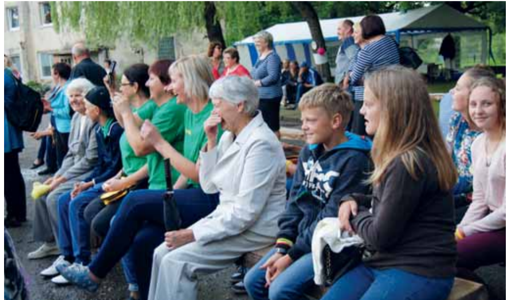
Šventėje susirinko būrys vietos gyventojų ir svečių.