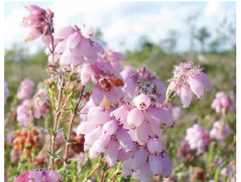
Tyrulinė erika ( Erica tetralix ).