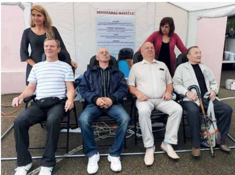
Buvo daug norinčiųjų nemokamai pasidaryti masažą.