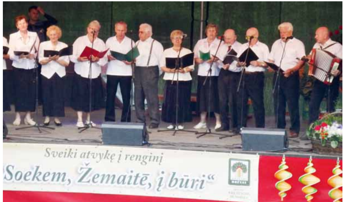
Šilutės bočių ansamblis Kretingos šventėje.

L iepos 6-ąją Šilutės bočių bendrija, turėdama kvietimą, išvyko į Kretingą, kur buvo organizuojamas Lietuvos pensininkų sąjungos „Bočiai“ bendrijų renginys „Sueikim, žemaitė, į būrį“. Renginyje dalyvavo Žemaitijos regiono „Bočių“ bendrijos, Skuodo, Naujosios Akmenės, Raseinių, Šiaulių, Plungės, Telšių, Kelmės ir Kretingos rajonų bei miestų bendrijos su meninėmis programomis.