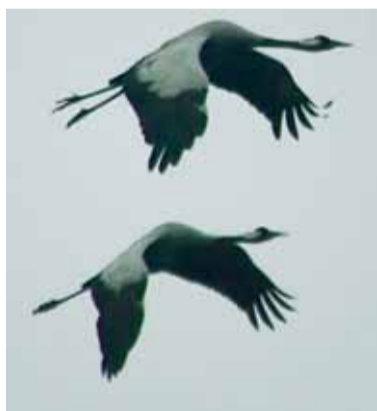
Pilkoji gervė ( Grus grus ) L. Jarašiaus nuotr.

na tausoti bei išsaugoti. Tai natūralūs distrofiniai ežerai, aktyvios aukštapelkės, degradavusios aukštapelkės, plikų durpių saidyrai, pelkiniai miškai, pelkėti lapuočių miškai. Buveinėse aptikta nemažai augalų bendrijų, tarp kurių 2 įtrauktos į Lietuvos augalų bendrijų Raudonąją knygą. Aukštumalos aukštapelkėje aptikta 175 aukštesniųjų augalų rūšys, iš kurių net 5 įtrauktos į Raudonąją knygą.