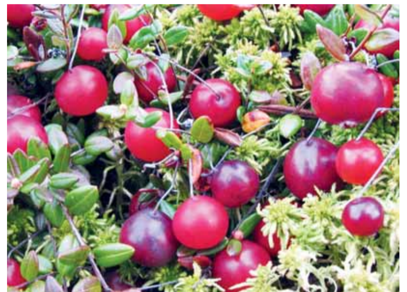
Paprastoji spanguolė ( Oxycoccus palustris ).