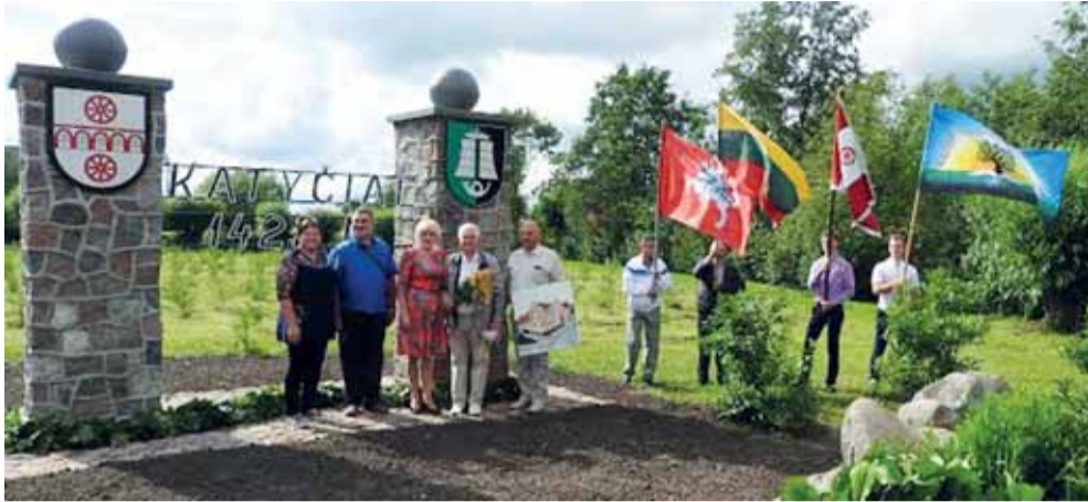
Atidengta Katyčių miestelio nuoroda nuo Natkiškių pusės.