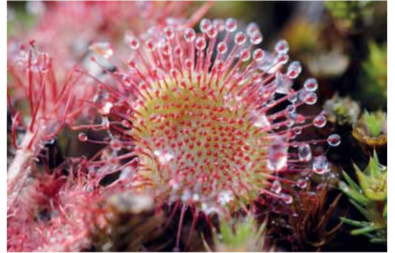
Apskritalapė saulašarė ( Drosera rotundifolia ).

Lankytojams pelkėje nereikėtų užmiršti, kad joje gyvena paprastosios angys (gyvatės). Jų įkandimas turėtų neigiamų pasekmių žmonių sveikatai. Todėl nepatariama šių roplių gaudyti.