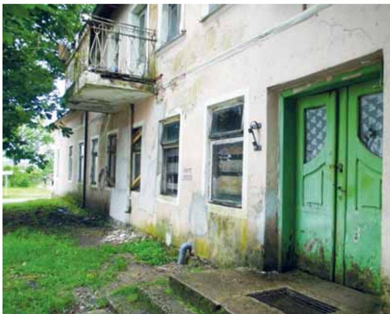
Kairėje pastato pusėje yra rusniškės patalpos, įsigytos kartu su bendrojo naudojimo koridoriumi.