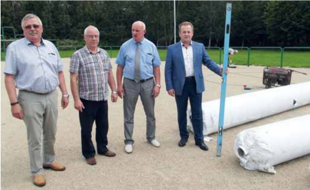
Baigiamoje įrengti sporto aikštelėje Naujakuriuose.