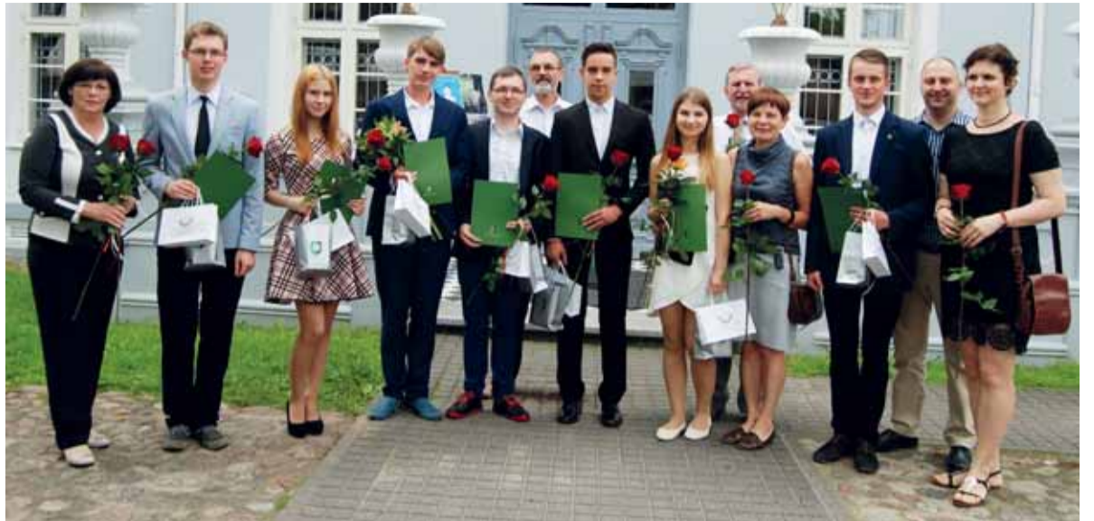
Geriausi rajono abiturientai ir jų mokytojai.