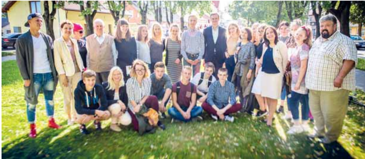
Tėvynės sąjungos-Lietuvos krikščionių demokratų pirmininkas Gabrielius Landsbergis susitiko su jaunimu, kuris itin domėjosi jo pristatomu planu.

Pasak kandidato, praėjusiais metais iš Lietuvos emigravo 45 tūkstančių gyventojų, per ketverius metus – 150 tūkstančių, ir jei tokia tendencija išliks, 2030 metais šaly-