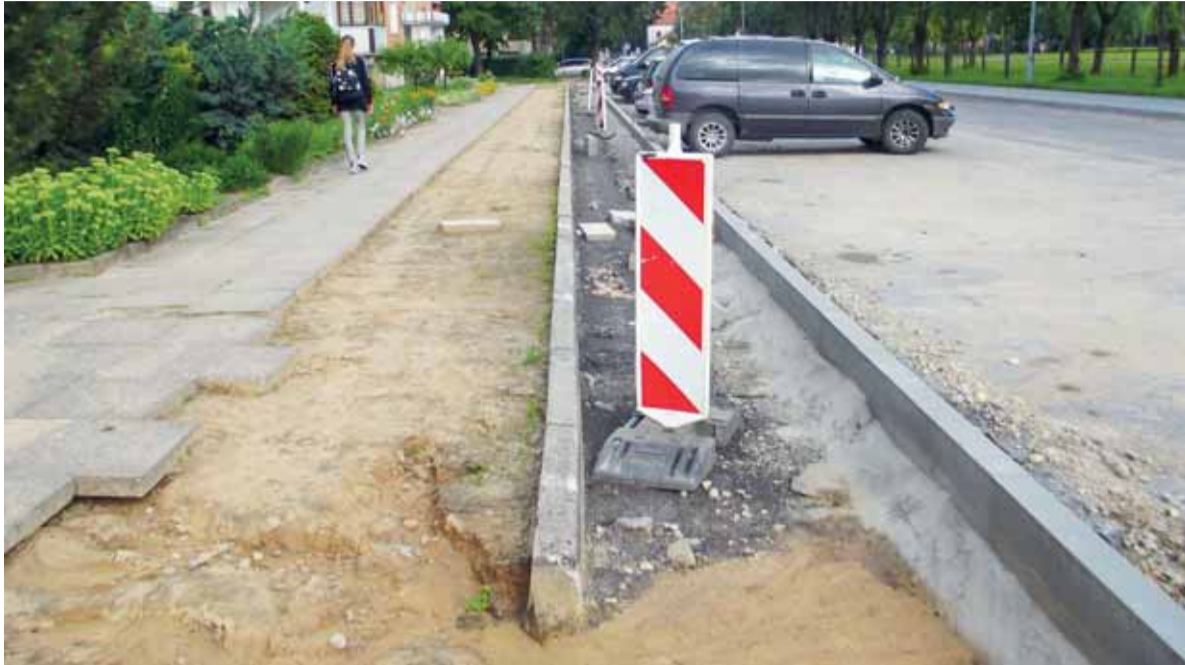
Akivaizdu, kad Kęstučio gatvėje padarius siauresnį šaligatvį, kuriuo nevaikšto daug pėsčiųjų, patogiau bus statyti automobilius – jie neatsidurs važiuojamojoje dalyje.

Šilutės rajono savivaldybės tarybos sprendimu pritarta dalyvauti dviejuose projektuose gerinant eismo saugumą rajone ir Šilutės mieste. Be to, kad eismas būtų saugesnis, jau atlikti kai kurie darbai rekonstruojant Dariaus ir Girėno bei Kęstučio gatves.