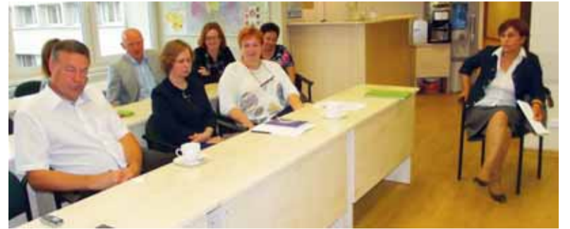
Politikai ir Savivaldybės administracijos darbuotojai neseniai diskutavo dėl vadinamojo H. Zudermano muziejaus Macikuose likimo.