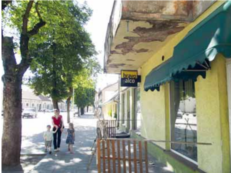
Balkonas kelia grėsmę praeiviams.

Ji dar kartą pažymėjo, kad šis namas yra kultūros paveldo teritorijoje, norint kažką daryti reikia išsiaiškinti priežastį, todėl reikalinga ekspertizė. Buvo paskelbtas konkursas ekspertizės darbams atlikti,