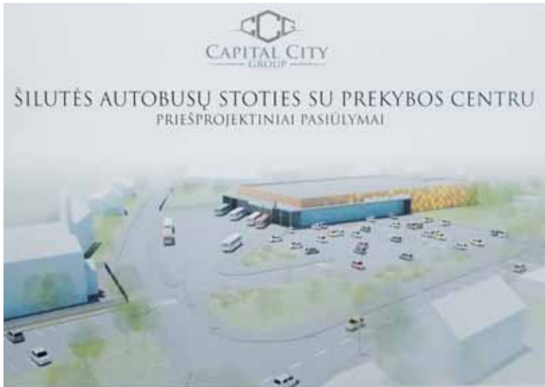
Šilutės autobusų stoties ir prekybos centro projektą pristatė nekilnojamojo turto projektų vystymo bendrovė „Capital city group“.

Pasak S. Šepučio, „Lidl“ atstovai tąkart išreiškė norą ne statyti naują „Autobusų parką“, siūlė perduoti šios bendrovės sklypą ir už tuos pinigus patiems pasistatyti autobusų stoties ir prekybos centro pastatus. Bet Savivaldybė, kaip valstybinė įstaiga, turėtų skelbti viešuosius projektavimo ir statybos darbų pirkimus, ir visa tai užsitęstų galbūt trejus metus. Atvykusieji iš „Lidl“ pažadėjo Vilniuje apsispręsti ir pateikti vienokį ar kitokį atsakymą Šilutės rajono savivaldybei.