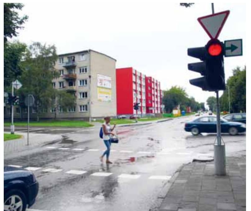
Vietoje keturšalės, šviesoforais reguliuojamos Cintjoniškių, Gluosnių ir V. Kudirkos gatvių sankryžos bus įrengta žiedinė sankryža.