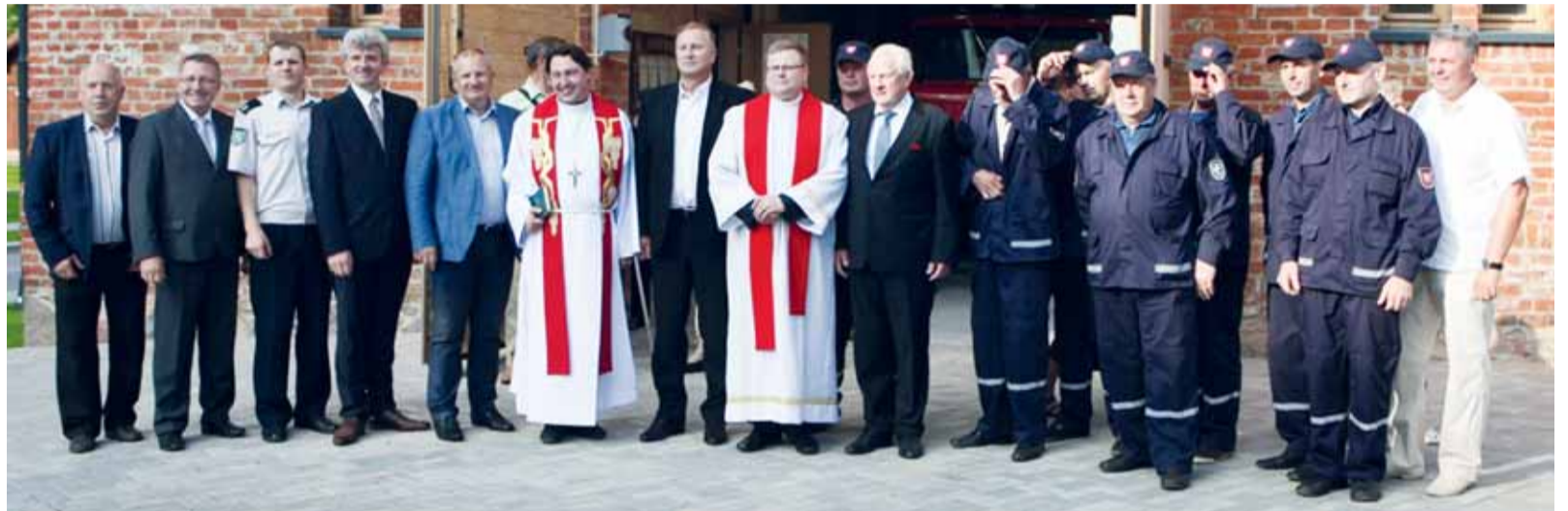
Nuotrauka atminčiai naujų Vilkyškių ugniagesių komandos patalpų atidarymo proga.

Pusę septintos vakaro buvo iškilmingai atidarytos naujosios Pagėgių savivaldybės priešgaisrinės tarnybos Vilkyškių ugniagesių komandos. Nuo šiol ugniagesiai įsikūrę restauruotame buvusio dvaro