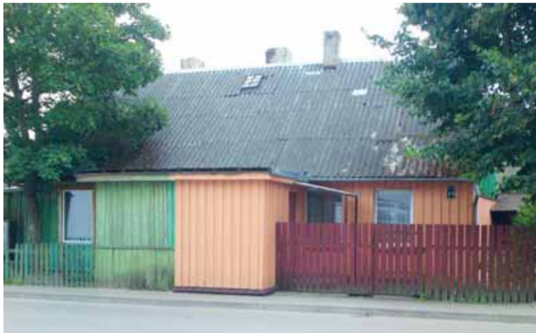
Vytauto gatvės 11-ame name, šalia didžiosios „Maximos“, trečiojo buto (18,20 kv. m) likutinė vertė – 0 eurų.