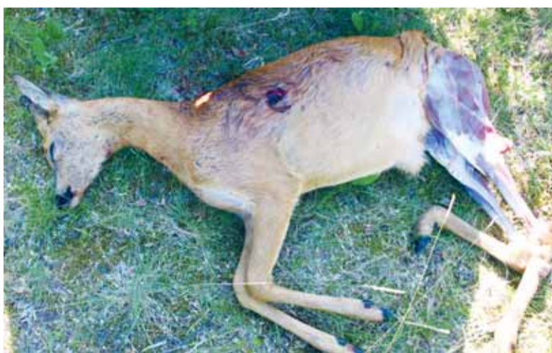
Brakonieriaus sumedžiotą stirniną nusipirkęs Vainuto gyventojas buvo spėjęs nulupti tik dalį jo kailio.

Jau antrąją akcijos dieną, birželio 2-ąją, Šilutės gyvosios gamtos apsaugos inspekcijos pareigūnai, pasak A. Tarvydo, gavę pranešimą apie neteisėtai sumedžiotą žvėrį, nuvyko į Vainuto miestelyje esančią sodybą. Stirnos patiną dorojęs vainutiškis pareigūnams išdavė, iš ko jis nusipirko šį sumedžiotą žvėrį. O brakonieriui, nustatytam taip operatyviai, nieko kito nebeliko, kaip tik prisipažinti neteisėtai sumedžiotą stirniną. Jam surašytas administracinio teisės pažeidimo protokolas, paimtas medžioklinis šautuvas, konfiskuotas automobilis „Dai-