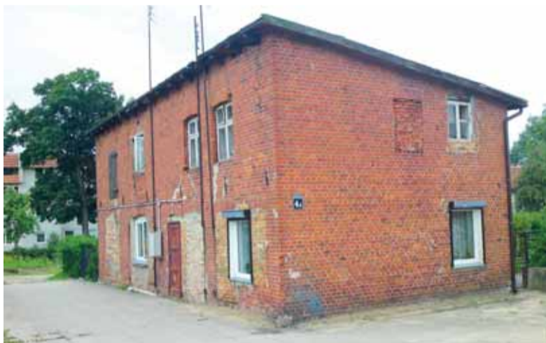
Žemaičių gatvės 4A name (prie Šilutės autobusų stoties) esančio buto (26,96 kv. m) likutinė vertė tik 29 centai.

ja pagal Vyriausybės nutarimą privalo parengti Tarybos sprendimo projektą, o pradinę nekilnojamojo turto kainą nustatoma atsižvelgiant į nepriklausomo turto vertintojo išvadą. Jei vieno ar kito objekto aukcione niekas nenuperka, komisija gali iki 10 proc. mažinti buvusią kainą.