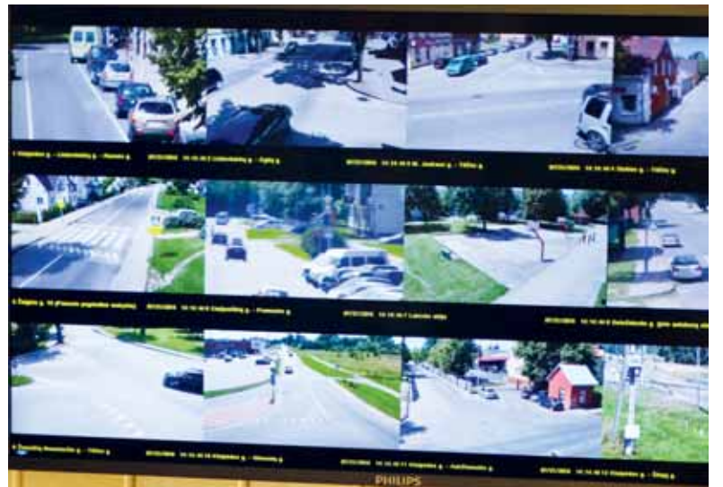
Į šiuos Šilutės miesto vaizdo stebėjimo monitorius policijos komisariete niekas nebežiūri – daromi vaizdo įrašai, kurie praverčia nebent tik įvykus nusikaltimui.

Niekas nebežiūri, ką rodo vaizdo stebėjimo kameros