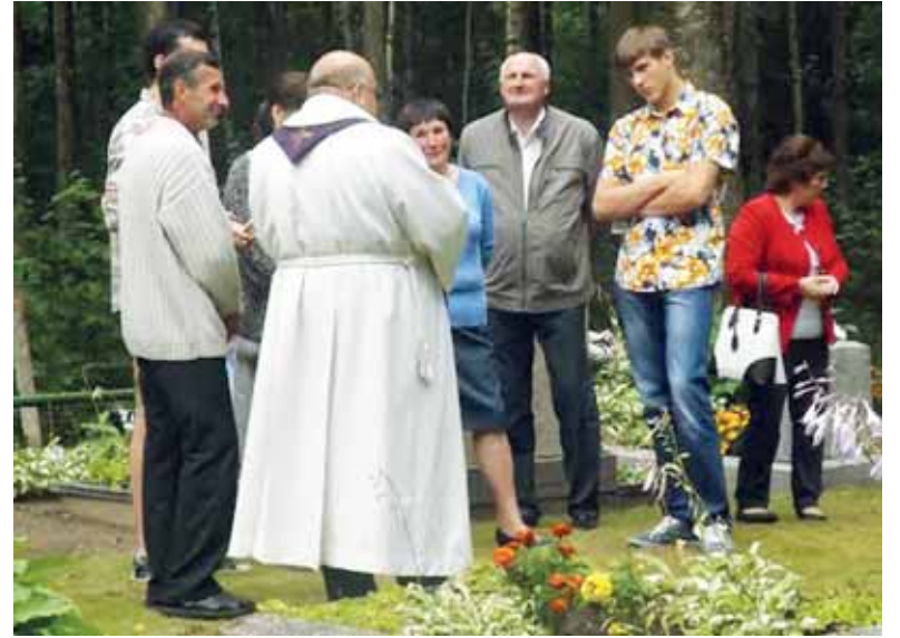
Kavolių senosiose evangelikų liuteronų kapinėse kasmet vyksta kapinių šventės.