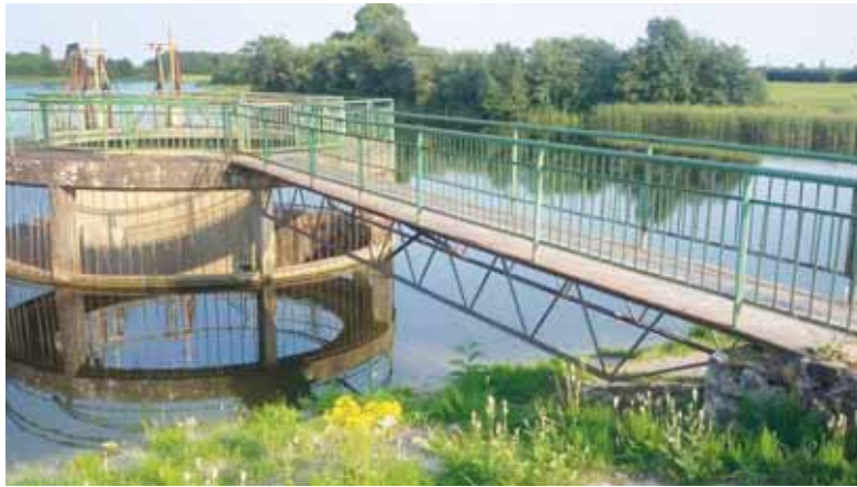
Šilutės rajone yra dar šešios nė karto kapitališkai neremontuotos užtvankos.

Degučių užtvanką jau sutvarkyta, Ramučiuose – pastatyta hidroelektrinė ir ten esančią užtvanką