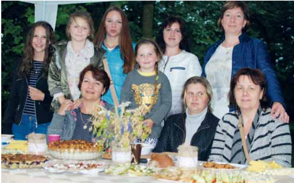
Galzdoniškiai mielai dalyvauja bendruomenės šventėse.