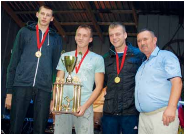
Dėduko atminimo taurė iškeliavo į Vainutą.