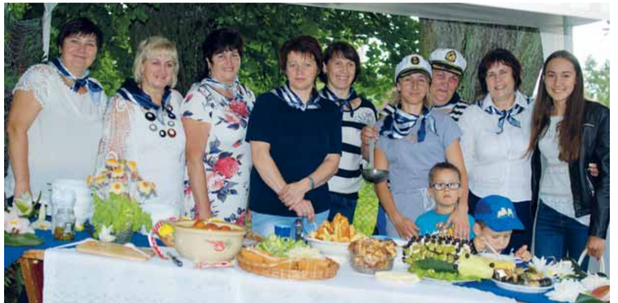
Savo skanumynais viliojo Žemaitkiemio kiemelis.

S avaitgalį į savo seniūnijos šventę „Perkūno kulkos“ kvietė usėniškiai. Itin lietingą savaitgalį ji truko net dvi dienas. O gerų nuotaikų nesugebėjo įveikti nei lietus, nei griaustinis.