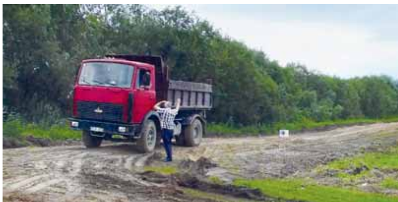
Šyšos vasaros polderio pylimo sutvarkymo darbai pradėti nuo Šyšos kaimo pusės.

ministracija yra Šyšos vasaros polderio rekonstrukcijos projekto įgyvendinimo partnerė.