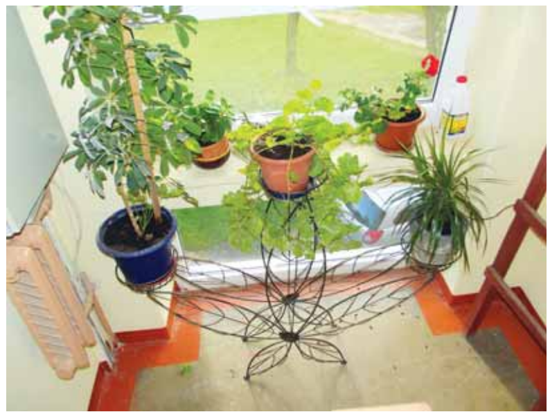
K. Kalinausko g. 11-ojo namo laiptinė ir valytoja nepriekaištingai valo, ir gyventojai puošia daugybe gėlių.