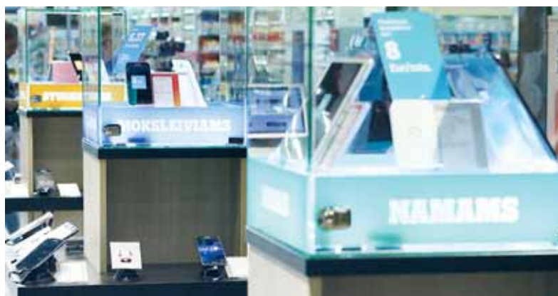
Sparčiausią mobilų internetą Šilutėje teikia „Tele2“.

2. Eksperimentuokite kartu su kulinarijos meistras. Paprastai kiekvienas turime po kelis mėgstamus patiekalus, kuriais lepiname savo artimuosius. Bet galbūt metas išbandyti kažką naujo? Garsiausi pasaulio šefai internete dalinasi įvairiomis virtuvės gudrybėmis ir receptais. Tad užklupus netikėtiems svečiams „Youtube“ susiraskite